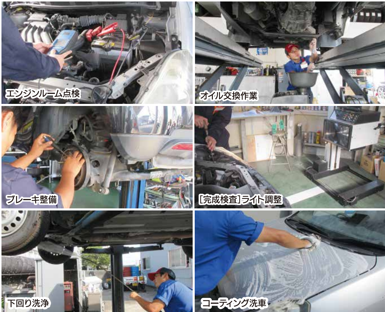
エンジンルーム点検